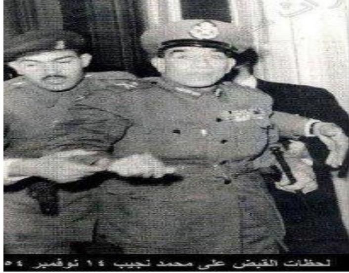
الرئيس: محمد نجيب لحظة القبض عليه من أنصار جمال عبد الناصر.